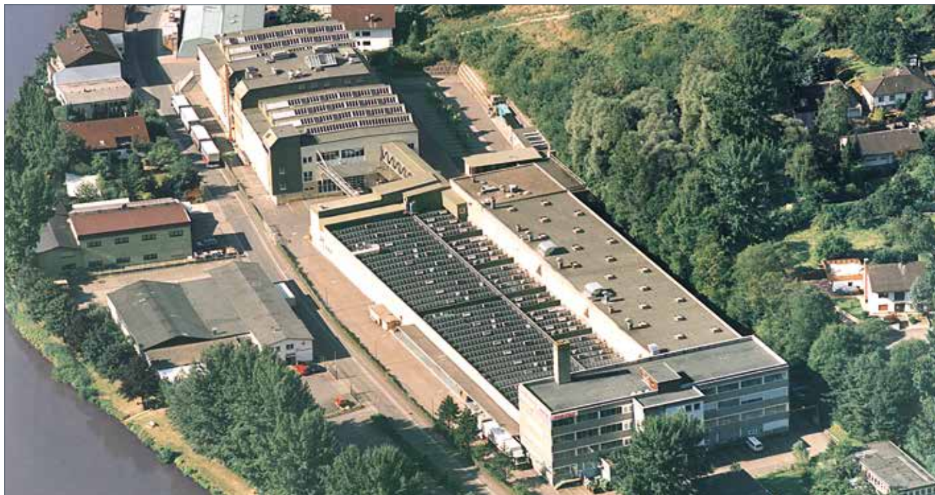
Stabilimento METO di Hirschhorn / Neckar - Produzione, amministrazione, magazzino

METO®, una divisione aziendale di Checkpoint®, propone una vastissima gamma di soluzioni innovative ed altamente convenienti per l'etichettatura e la promozione delle vendite per il commercio al dettaglio globale, ad esempio comunicazione e pubblicità in-store, gestione dello scaffale, etichettatura e shopping convenience.